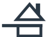
Sur fond clair