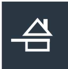
Sur fond sombre