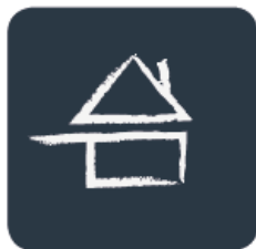
Reproduit à la main