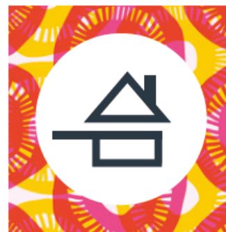
Sur fond perturbé